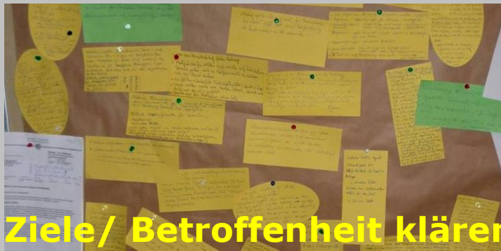
Ziele/ Betroffenheit klären