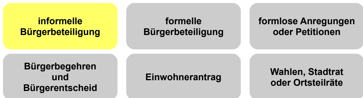
Abb. 2: Verschiedene Wege der Bürgerbeteiligung

In Jena haben Bürgerinnen und Bürger vielfältige Möglichkeiten, ihre eigenen Sichtweisen vorzustellen und Einfluss zu nehmen, um die Stadt und das Zusammenleben in Jena mitzugestalten. Im Mittelpunkt dieser Leitlinien steht die sogenannte "informelle" Bürgerbeteiligung. Durch diese kreativen Formen der Bürgerbeteiligung werden die übrigen Wege der Bürgerbeteiligung ergänzt und eine lebendige Beteiligungskultur in Jena gestärkt. In Abbildung 2 werden die verschiedenen Formen der Bürgerbeteiligung im Überblick dargestellt, die anschließend näher erläutert werden.